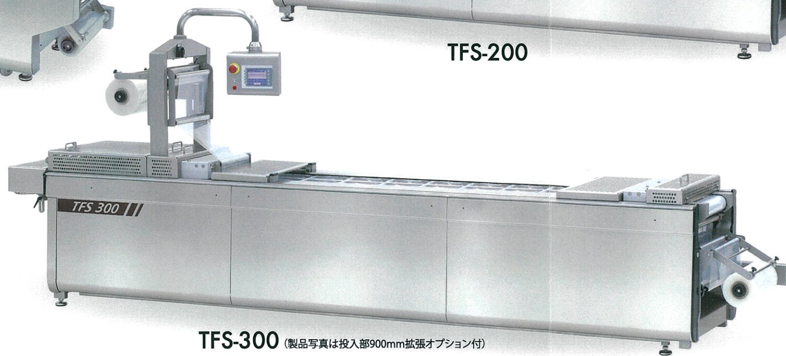
TFS-300 (製品写真は投入部900mm拡張オプション付)