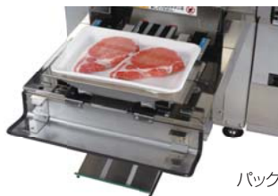
パック商品の値付も可能